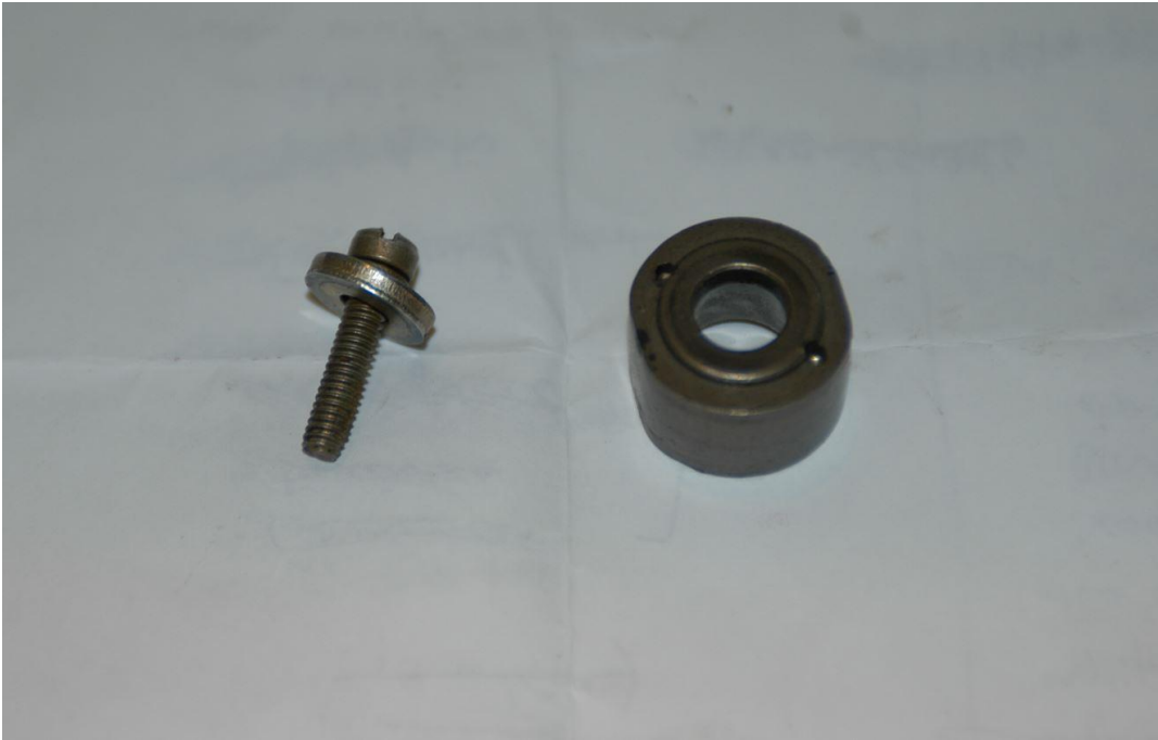
Abbildung 4: Befestigungsschraube und Verteilernocke