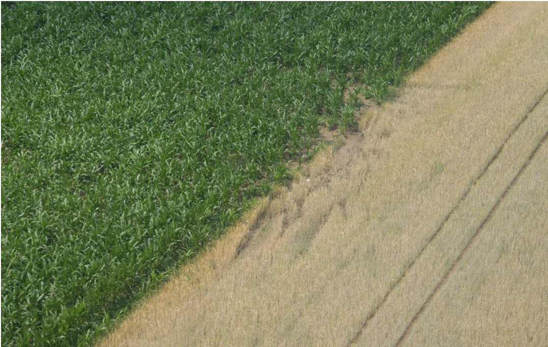
Abbildung 2: Unfallstelle von oben mit Abdrücken des bereits entfernten Luftfahrzeuges