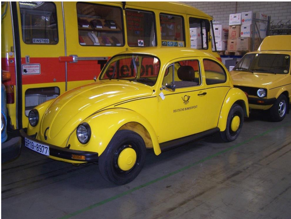
Abbildung 1: Foto von VW 1200 der Deutschen Bundespost im Depot des Museums für Kommunikation in Heusenstamm.

Datei: VW 1200 Heusenstamm 05082011 01.JPG, Quelle: https://commons.wikimedia.org/w/index.php?curid=16136415