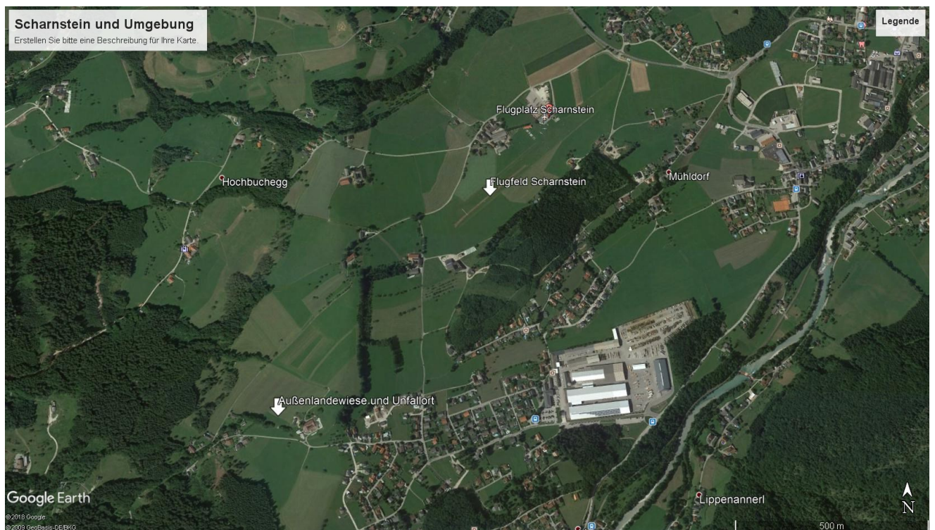
Abbildung 2: Lage des Unfallortes in Bezug auf das Flugfeld Scharnstein

Die Außenlandewiese befindet sich in südwestlicher Richtung ca. 900m von der Pistenschwelle 05 des Flugfeldes Scharnstein entfernt. Auf der Außenlandewiese verläuft eine Niederspannungsleitung in Ost- West Richtung.