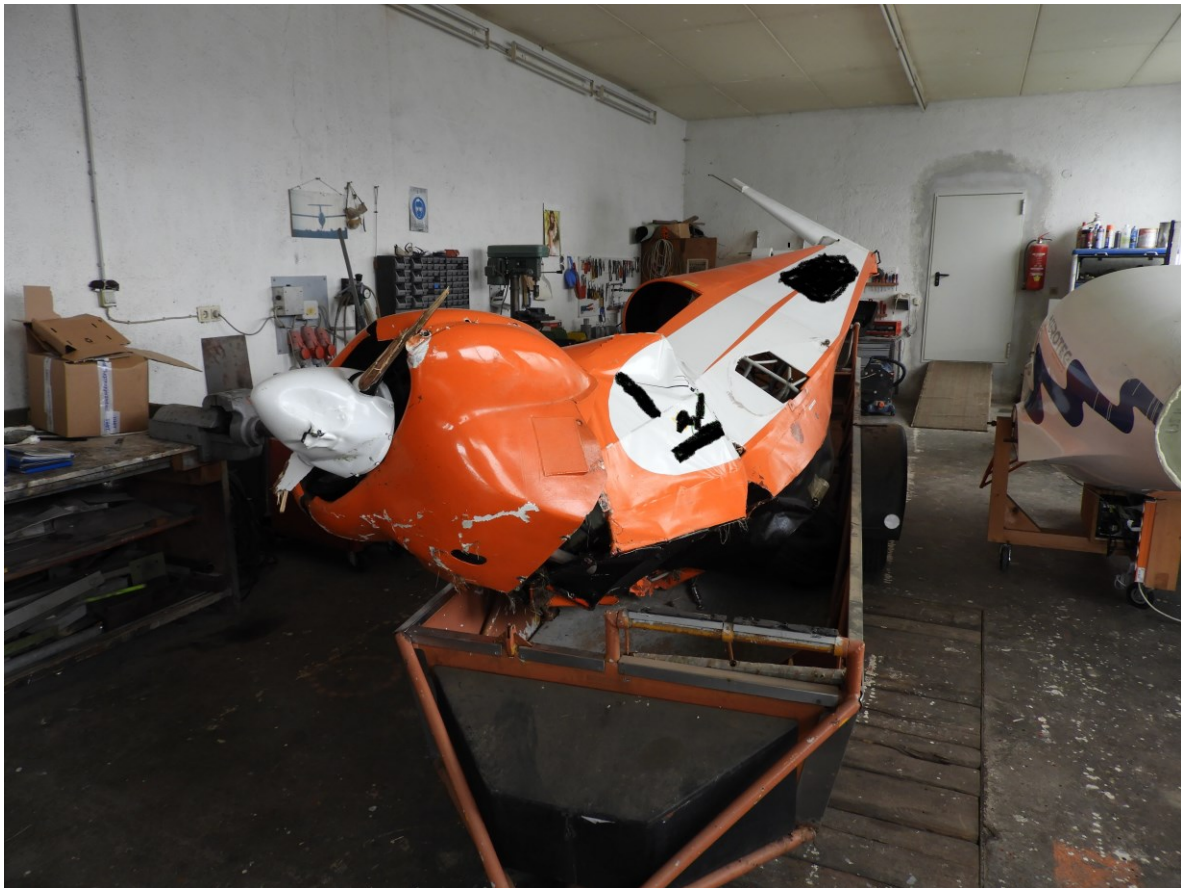
Abbildung 4: Rumpf des Motorsegler SF-28A