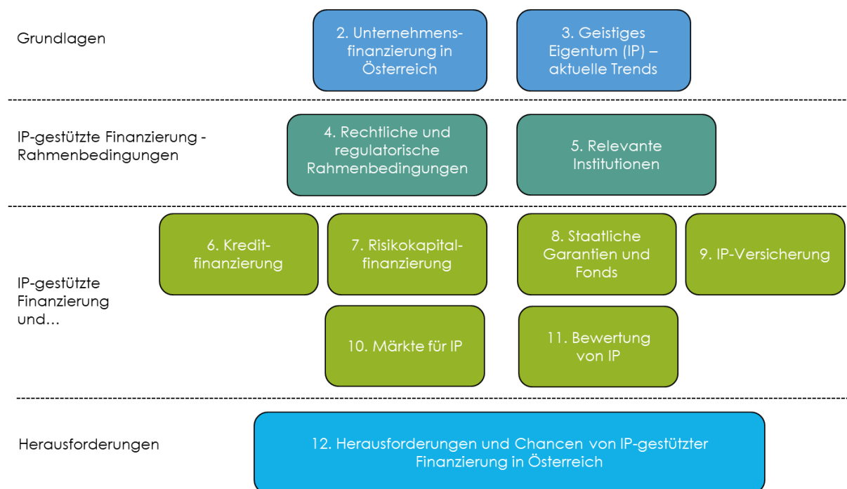
Abbildung 1: Struktur des Berichts

ihren Beitrag leisten (vgl. auch IP-Strategie 2018) 2 . Dieser Bericht dokumentiert den Status-Quo der IP-Finanzierung in Österreich und weist auf die wichtigsten Herausforderungen hin. 3