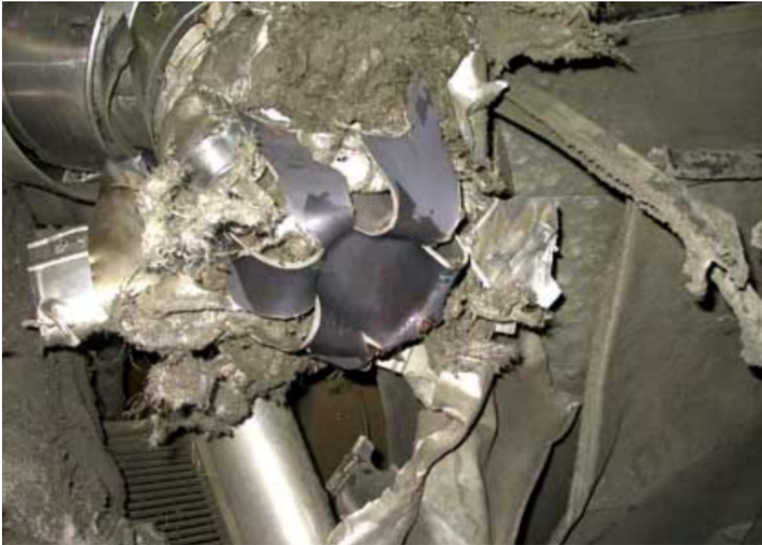
Abbildung 1: Noch einmal Glück gehabt. Eine Wasserstoffexplosion innerhalb des Sicherheitsbehälters des deutschen Atomkraftwerkes Brunsbüttel im Jahre 2002 hätte auch zu einer Katastrophe führen können. Solche Unfälle werden in alternden Anlagen wahrscheinlicher.