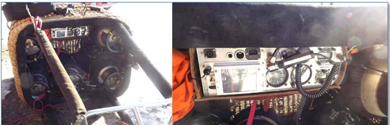
Abb. 6: Innenaufnahme des Ballonkorb

Der Korb entsprach hinsichtlich Ausrüstung und nutzbarer Bodenfläche den Vorgaben des Flight Manuals.