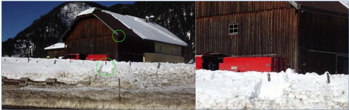
Abb. 5: Unfallstelle und Dachrinne

Der Kontakt des Ballonkorbes an der rund 3,4 Meter hohen Straßenböschung der Bundesstraße 166 hinterließ deutlich sichtbare Spuren im Schnee.