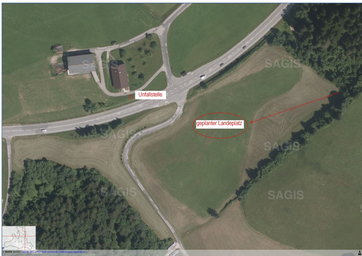
Abb. 4: Luftaufnahme des geplanten Landeplatzes und der Unfallstelle

Die erste Bodenberührung erfolgte 6 Meter nordwestlich der Bundesstraße B166 nahe eines Nebengebäudes. Der Ballon kam schließlich an einem vom ersten Bodenkontakt rund 12 Meter entfernten Scheunengebäude zum Stillstand.