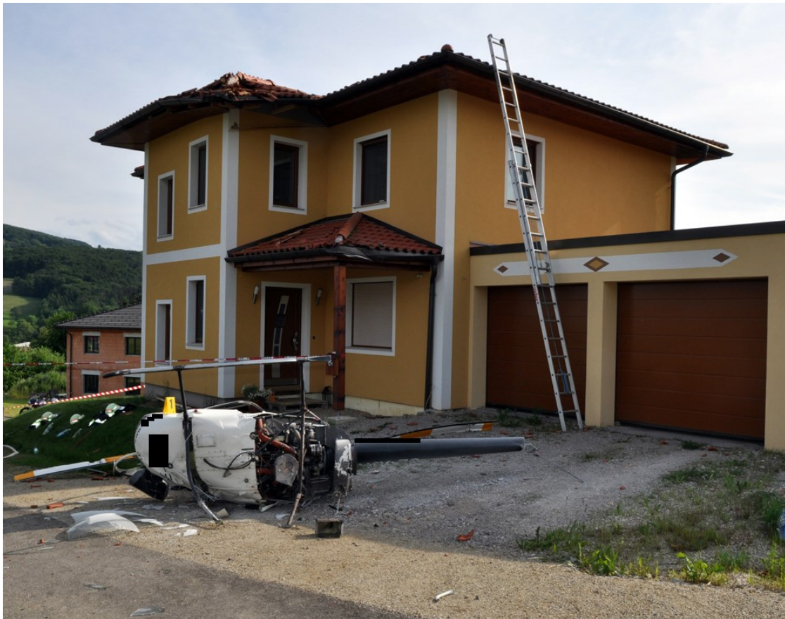
Abbildung 2: Unfallstelle mit verunfalltem Hubschrauber