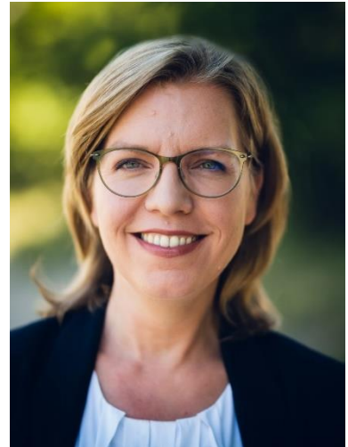
Leonore Gewessler, BA Bundesministerin für Klimaschutz, Umwelt, Energie, Mobilität, Innovation und Technologie

Das Jahr 2020 stand im Zeichen der Corona-Pandemie. Auch für den öffentlichen Verkehr stellte die Pandemie eine große Herausforderung dar. Um die Ansteckungsgefahr so klein wie möglich zu halten wurden die Menschen in Österreich aufgefordert zuhause zu bleiben und Fahrpläne wurden an die neue Situation angepasst um unnötige Leerfahrten zu verhindern. Viele Pendlerinnen und Pendler in systemrelevanten Bereichen – wie Medizinisches Personal, Sicherheitskräfte, Menschen im Versorgungsbereich – mussten weiterhin ihre Arbeitsstellen erreichen. Daher war es wichtig, Leistungsrücknahmen nur sehr beschränkt und über einen kurzen Zeitraum durchzuführen.