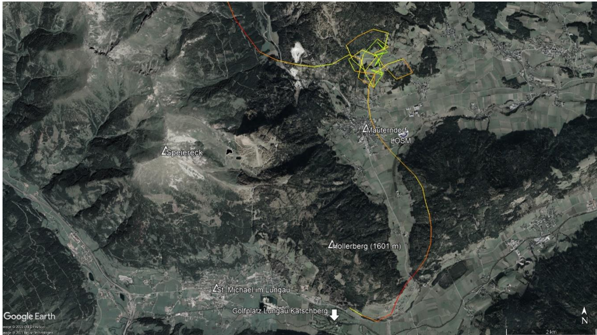
Abbildung 2 Flugabschnitt Bereich Mauterndorf bis St. Michael im Lungau. Färbung nach Steig-/Sinkrate (Grün=Steigen, rot=Sinken)