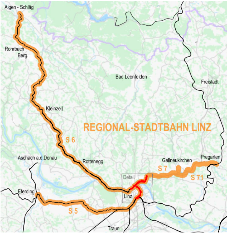
Abbildung 1 Liniennetz der Regionalstadtbahn Linz